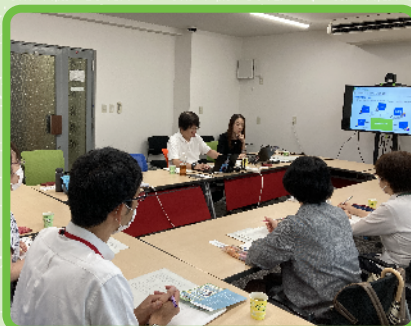
ハローワーク研修会でのプレゼン