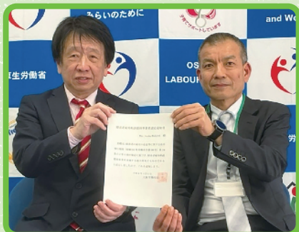
大阪労働局から認定通知書を受領

当社The Linksは、この「障害者雇用相談援助事業者」として、大阪労働局から大阪で一番に認定されました!